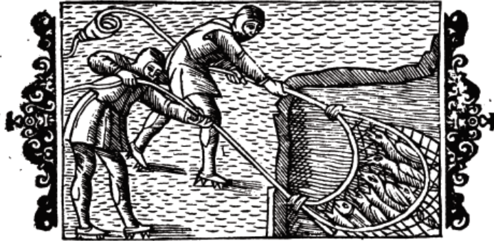
Abbildung in: Olaus Magnus, Historia de gentibus septentrionalibus , Rom 1555, S. 673

Vermutlich kannte LAUREMBERG diesen Bericht und brachte ihn aus dem Gedächtnis, etwas ausgeschmückt, zu Papier – vielleicht auch aus anderen Schriften. 11 Was er zur empirischen Beglaubigung der Sache schreibt, dass Fischer im Winter mitsamt ihrem Fischfang oft grosse Mengen von scheinbar toten Schwalben herauszögen, die wieder zum Leben »erwachten«, stimmt in etwa mit Olaus' Bericht überein.