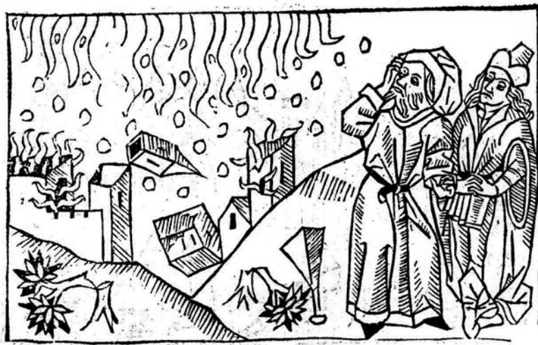
Der Antichrist und Die fünfzehn Zeichen vor dem Jüngsten Gericht, Faksimile der ersten typograph. Ausgabe um 1480, mit Beitr. von Karin Boveland u.a., Hamburg: Wittig 1979.