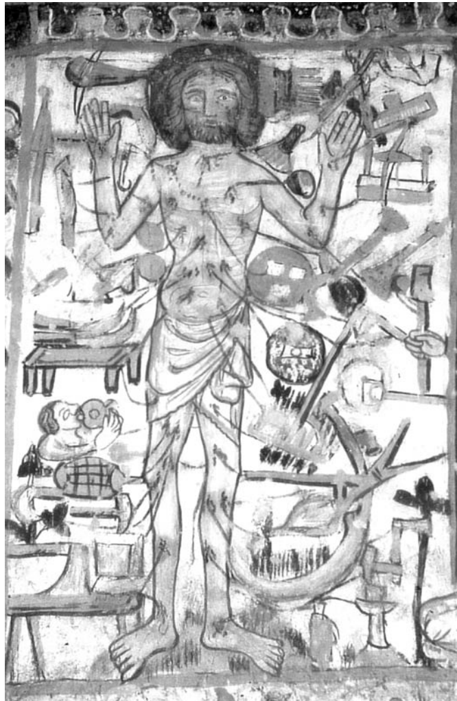
Feiertagschristus aus der Kirche Sogn Gieri bei Rhäzüns (Kanton Graubünden), Fresken des Waltensburger Meisters um 1330/40

Struktur: Es handelt sich um einen Tun-Ergehen-Zusammenhang. (Struktur 2D in der Variante ohne S I). Es werden zwei Figuren(-gruppen) gezeigt: die Feiertagsschänder im Gegensatz zu dem Mäher, der den Sabbat heiligt und belohnt wird (Situation II). Die Belohnung erfolgt zwingend aus der Historie, zunächst nicht durch ein übernatürliches Eingreifen (in Hondorffs Deutung wird dieses dann doch noch bemüht). Die Funktion (3E): Es geht um das Einpauken des dritten Gebots. Auslegungstechnik: Der Predigthörer darf oder soll abstrahieren (4B) von der speziellen handwerklichen Tätigkeit des Mähens; es sind alle Berufsgruppen gemeint.