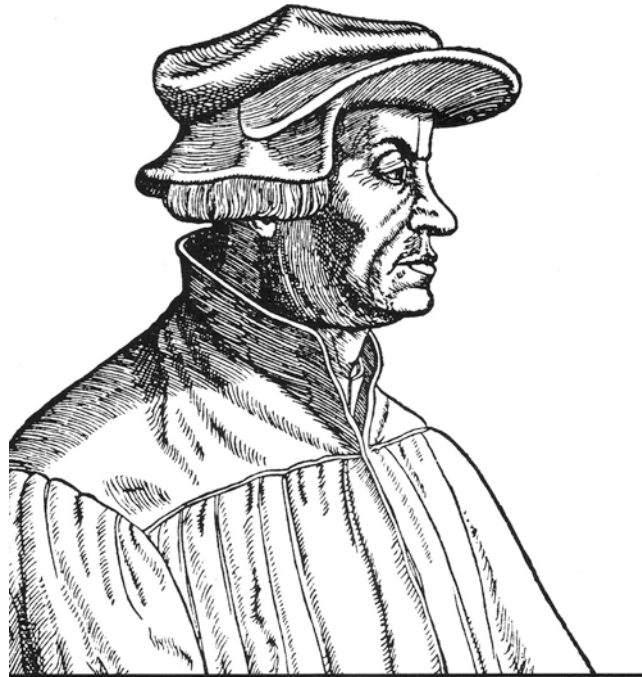
Zwingli-Portrait vom Jahr 1531; aus: In evangelicam historiam de domino nostro Iesu Christo, per Matthaeum, Marcum, Lucam & Iohannem conscriptam. Epistolasque aliquot Pauli, Annotationes Huldrychi Zwinglii. Per Leonem Iudae exceptae & aeditae , Tiguri: Froschauer, 1539.

organisiert ein Wurstessen in der Fastenzeit – verfasste Bibelauslegungen und Kampfschriften – gefallen in der Schlacht bei Kappel.