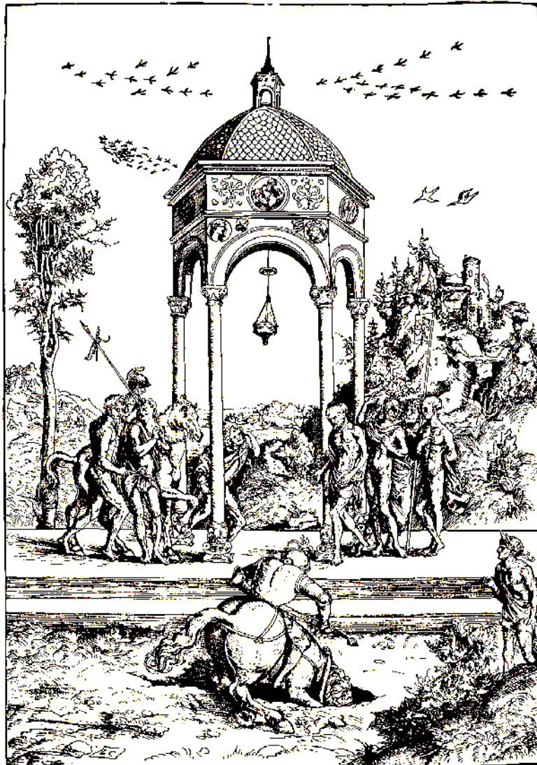
Opfertod des Marcus Curtius, Holzschnitt von Cranach, um 1507

Die Struktur ist vom Typ 2D (vom Orakel interpretierte Situation I – Handlung des Curtius – Situation II, die vom Numen sofort gedeutet wird). Man erkennt hier gut, wie nahe die Funktionen des Exemplums (3E) und die der semantischen Erklärung (3A) miteinander verwandt sind: Die Geschichte zeigt, sowohl, dass man für den Staat Opfer bringen soll, als auch erklärt sie die Begriffe der virtus , pietas . Nimmt man sie als Handlungsanweisung, so muss, insofern als sich eine analoge Situation nicht wieder so schnell einstellen wird eine starke Induktion erfolgen (4B).