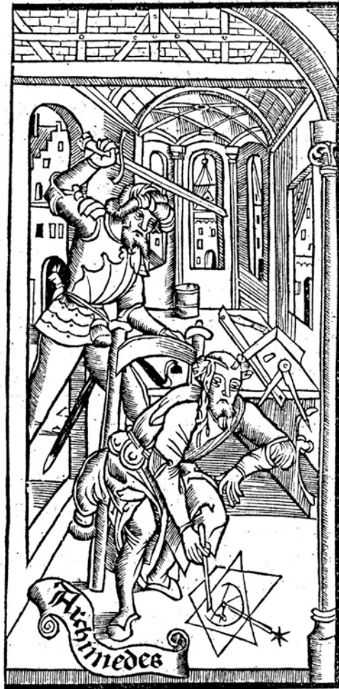
Die gestörten Kreise des Archimedes, Holzschnitt eines unbekanntenen Meisters aus: Romische Historie / Uß Tito Livio gezogen. Mainz: Schoffer 1505; fol. CXXXXr.