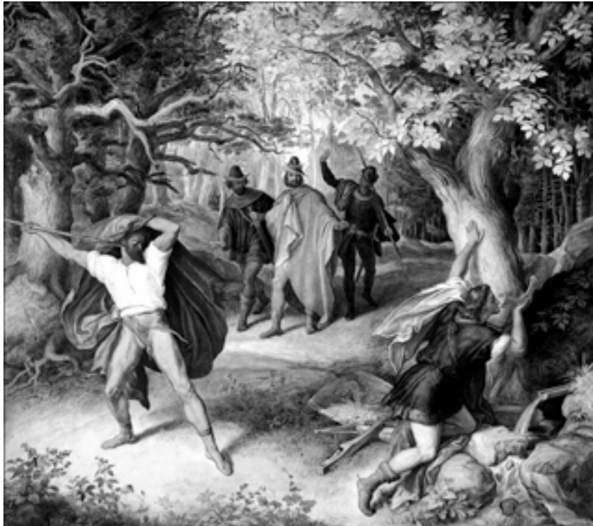
Hagen ermordet Siegfried. Wandgemälde Julius Schnorr von Carolsfeld (1794–1872) im »Saal des Verrats« der Münchener Residenz, aus: http://www.uni-oldenburg.de/presse/uni-info/2006/9/thema.html

Ein übles Kapitel in der Rezeption mittelalterlicher Dichtung stellt die Instrumentalisierung des Nibelungenlieds dar. 40