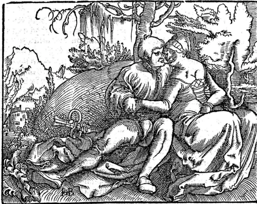
Liebespaar. Holzschnitt des Hans Baldung Grien aus: Des hochgelerten doctor Keiserspergs Alphabet in XXIII. Predigen so er gethon und die geordnet hat an einen baum. XXIII. est uffgesteigen zu ewigem leben gut zulesen und davon man wol gebessert mag werden, Straßburg: Grieninge 1518.

enflammierte Männer bei ihren Annäherungsversuchen in Phasen verstehen. Beides wäre dem Typ 3C zuzuordnen.