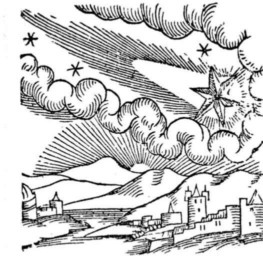
Donnerstein von Ensisheim: Conrad LYCOSTHENES, Wunderwerck Oder Gottes vnergründliches vorbilden, Basel: Henric Petri 1557, Holzschnitt zum Jahr 1492, pag. cccclvij.

Am 7.11.1492 schlug in der Nähe von Ensisheim ein ca. 127 kg. schwerer Meteorit ein. Conrad LYCOSTHENES 13 notiert zu diesem Jahr: