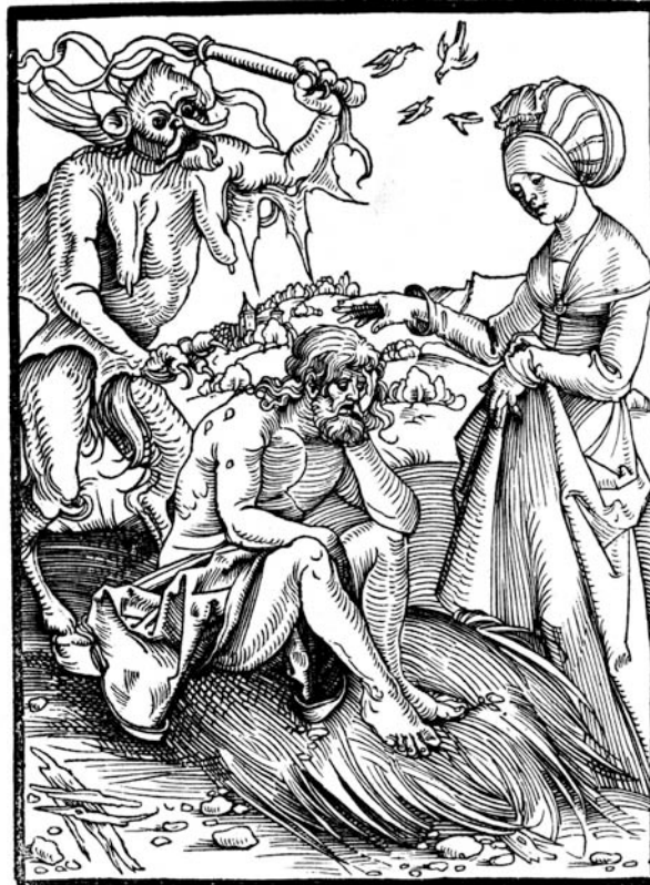
Der aussätzigte Hiob auf dem Misthaufen, aus [Ulrich Pinder] Speculum Patientie cum theologycis consolationibus fratris Ioannis de Tambaco. Sacrepagine professoris excellentissimi materia multum delectabilis nominis utilis et praedicabilis omnim fere morborum animi cuiusque persone quovismodo tribulate consolatione atque medicinam continens, Nurenberg 1509.

Geduld ist. Alle diese Erzählungen haben die Struktur 2D und erfordern die Auslegungstechnik der Induktion (4B).